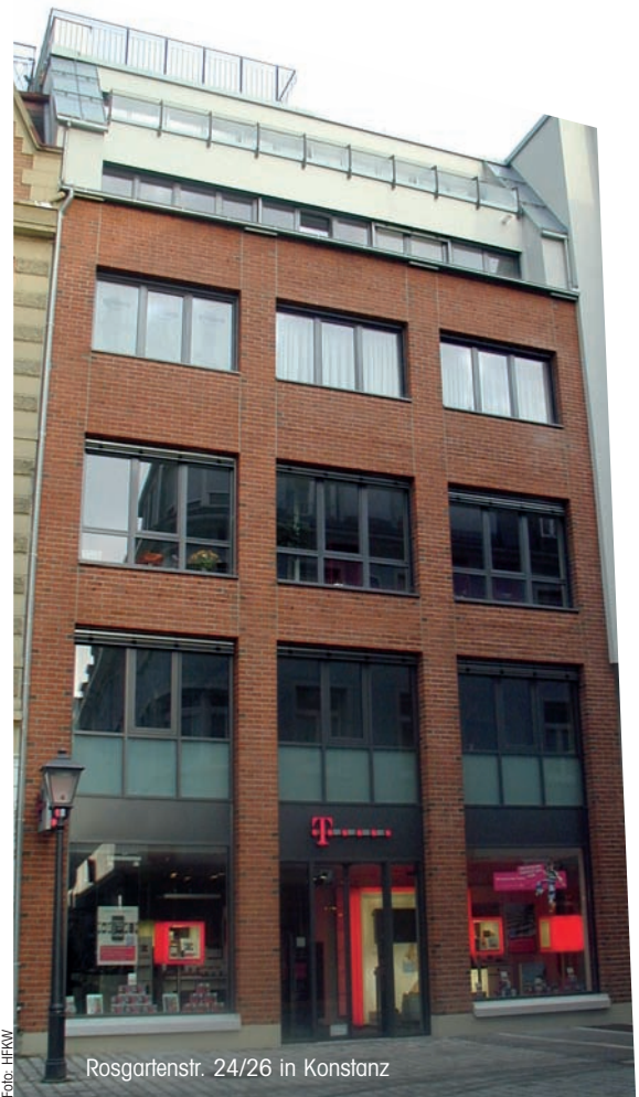
Rosgartenstr. 24/26 in Konstanz

Eine weitere Besonderheit der Gebäudetechnik ist ein elektronisches Steuerungs- und Managementsystem mit graphischer Anlagensvisualisierung, mit dem alle Inneneinheiten ferngesteuert werden können. Zusätzlich wurde auf dem Zentralmodul eine Software installiert, die zur Erfassung und Aufzeichnung der Verbrauchswerte dient und die Kostenabrechnung so wesentlich erleichtert.