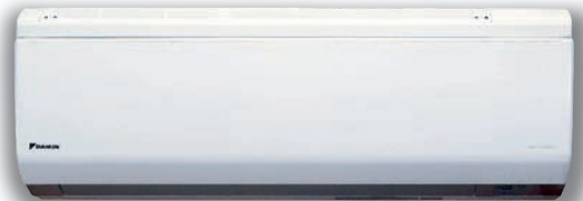
„Ururu Sarara“ von Daikin

Mit der Einführung seines neuen Klimagerätes mit dem exotischen Namen „Ururu Sarara“ (japanisch ururu = befeuchten und sarara = entfeuchten) zeigt der Klimaspezialist Daikin besondere technologische Kompetenz. Denn das innovative System vereint gleich sechs unterschiedliche Funktionen in einem einzigen Gerät und ermöglicht dem Nutzer somit nicht nur das Kühlen und Heizen, sondern auch das Be- und Entfeuchten von Räumen sowie die Frischluftzufuhr und mehrstufige Luftreinigung. Das Gerät steht in drei Größen mit einer Nennleistung von 2,8 kW, 4,2 kW bzw. 5,0 kW zur Verfügung, die alle das Energielabel Klasse „A“ tragen und damit zu den sparsamsten Geräten auf dem europäischen Markt gehören.