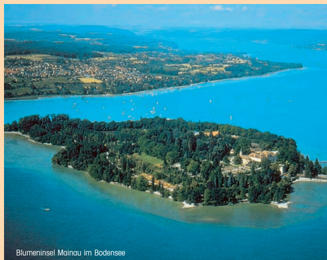
Blumeninsel Mainau im Bodensee

Momentan werden die Wartungsverträge auf die neuesten gesetzlichen Bestimmungen hin überprüft und entsprechend angepasst. Künftig werden sämtliche Lüftungsanlagen komplett mechanisch gewartet, die Reinigung der Gerätekammern erfolgt mit Desinfektionsmittel, es wird mehrmals pro Jahr ein Filterwechsel durchgeführt, und auch die gesamten mess- und steuertechnischen Komponenten werden kontrolliert. Bei den künftigen Wartungsarbeiten werden insbesondere die Anforderungen der Hygienerichtlinie VDI 6022 mit den jeweils geforderten Hygieneuntersuchungen und Auswertungen umgesetzt.